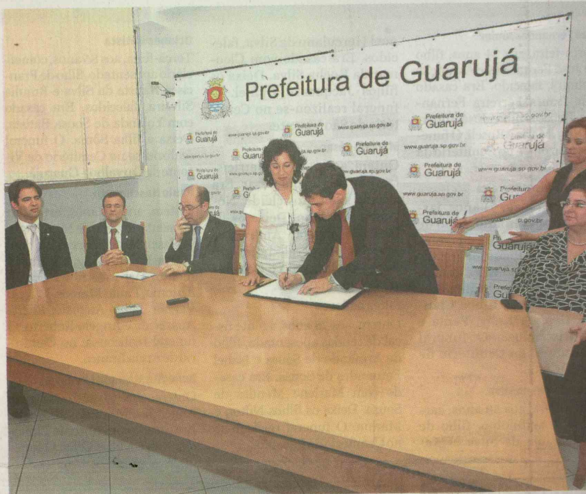
Representantes do Município e da União firmam Termo de Ajustamento de Conduta sobre a orla da praia