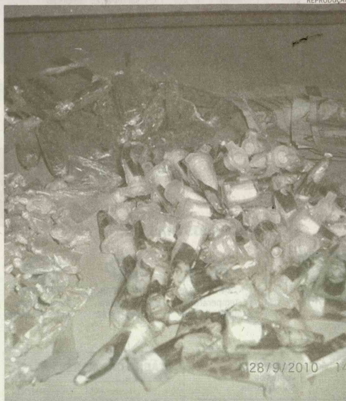
Porções da droga vinham embaladas com imagem do ex-jogador

O adolescente admitiu, segundo boletim de ocorrência, que traficava. Mas, temendo represálias, não deu informações sobre o dono do entorpecente. O menor foi apreendido. A polícia trabalha para identificar o fornecedor do